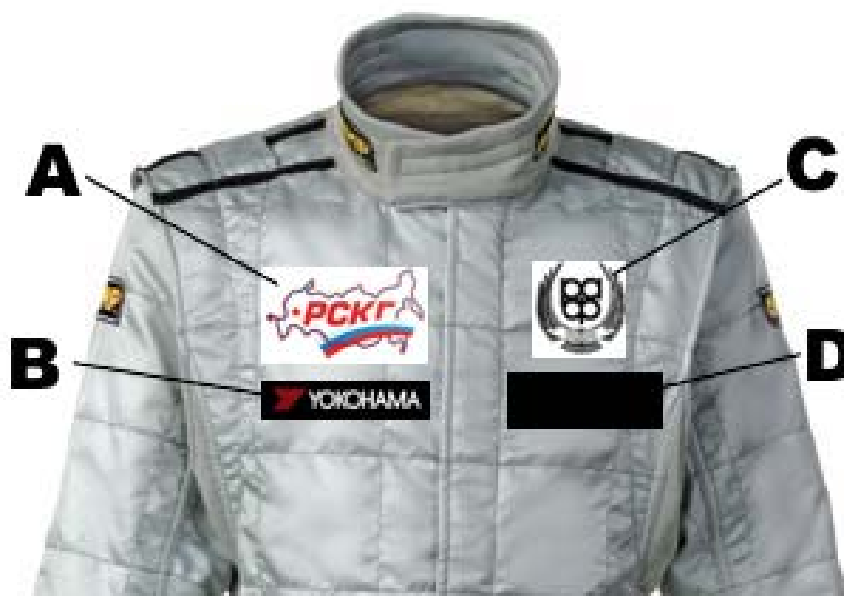
Рис. 1. Схема расположения спонсорских нашивок на комбинезоне пилота.