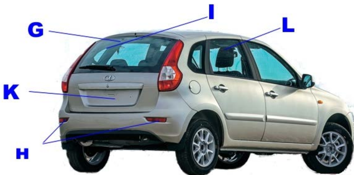
Рис. 4 Схема расположения обязательных наклеек на автомобиле. Вид \frac{3}{4} сзади.