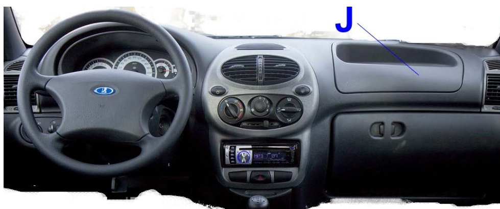
Рис. 2 Схема расположения обязательных наклеек на приборной панели, в зоне on-board камеры.